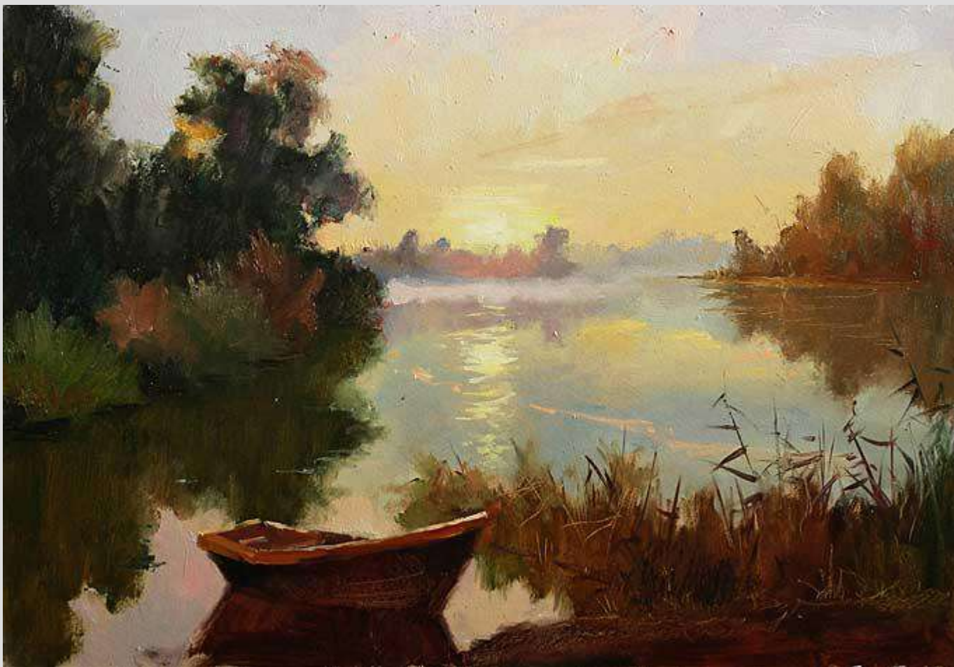
Теплий вечір 2012 Картон, олія 28x40