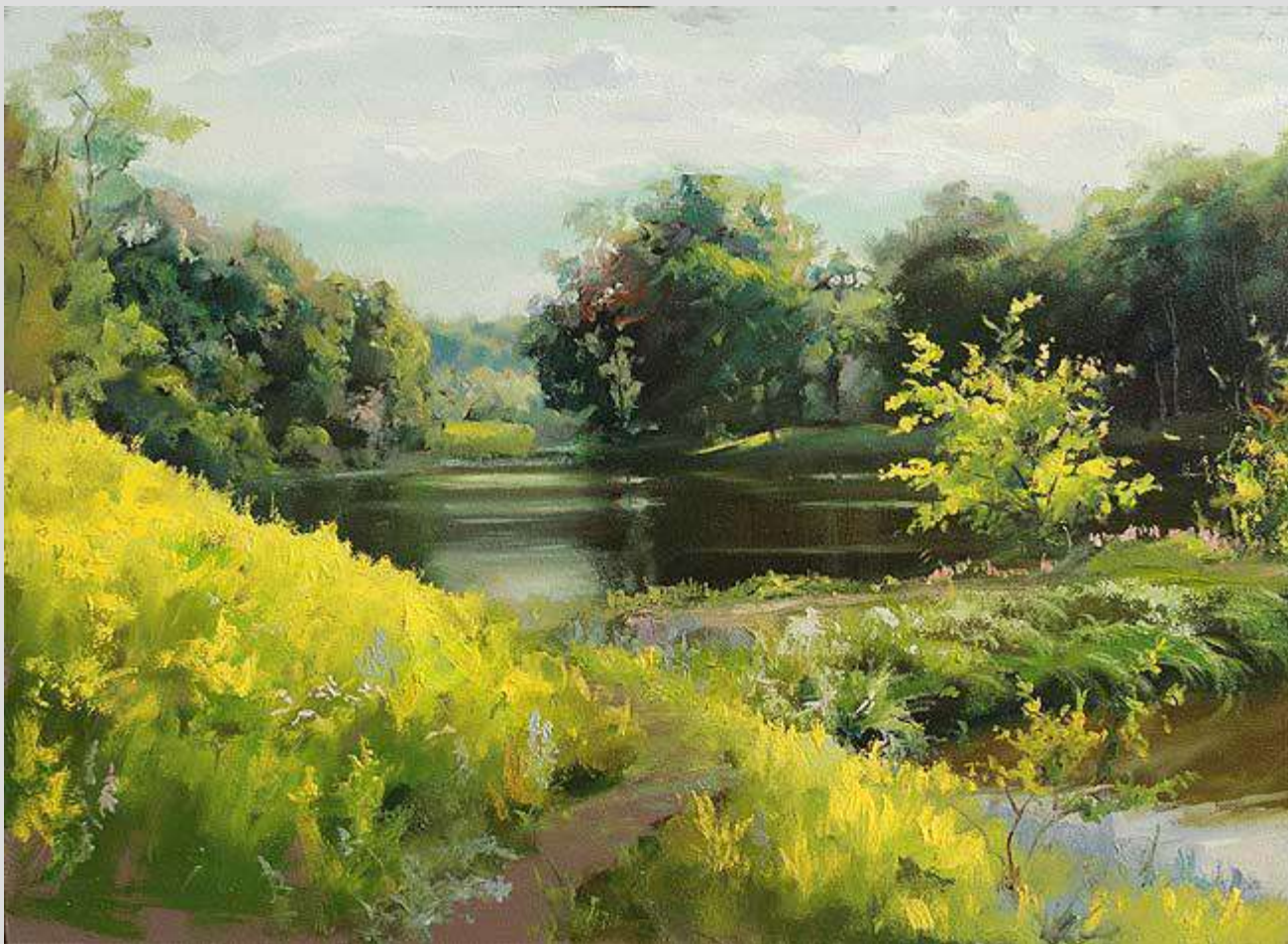
Оникієве. Ставок 2011 Картон, олія 34x50