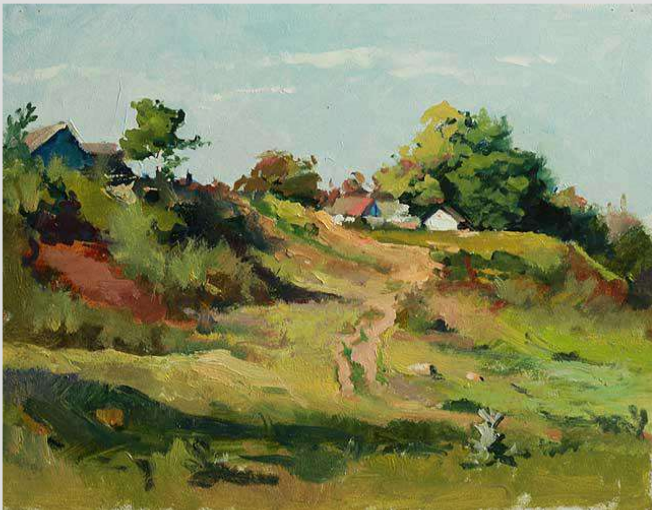
Над Синюхою 2011 Картон, олія 31x40