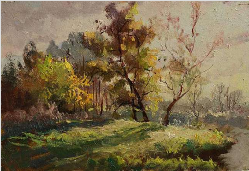
Кіровоград. Солдатські ставки, 2010

Ліричний пейзаж ,або як його ще називають, пейзаж настрою, виразно передає глядачеві враження художника від природи в момент написання картини. Це може бути спокійна тиша і спокій туманного ранку, або зневіра і безвихідь холодної похмурої осені.