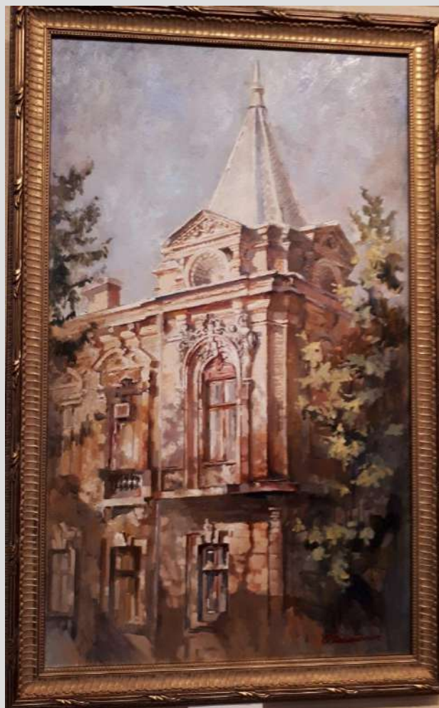
Вулиця Віктора Чміленка Із серії "Вулицями міста" 2018 Полотно , олія