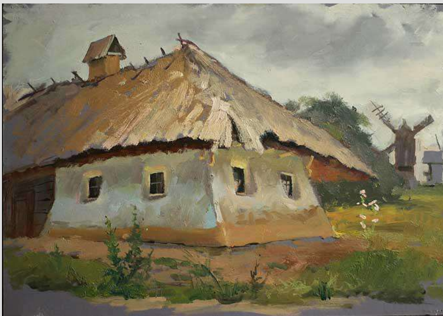
Пирогово. Перед грозою 2012 Картон, олія 27х39

У його пейзажах природа одухотворена непомітною присутністю людини, її настроями і думками, про існування якої нагадують церкви, мости, хати, шляхи. Якщо уважно дивитись на картину, починаєш відчувати себе серед того пейзажу.