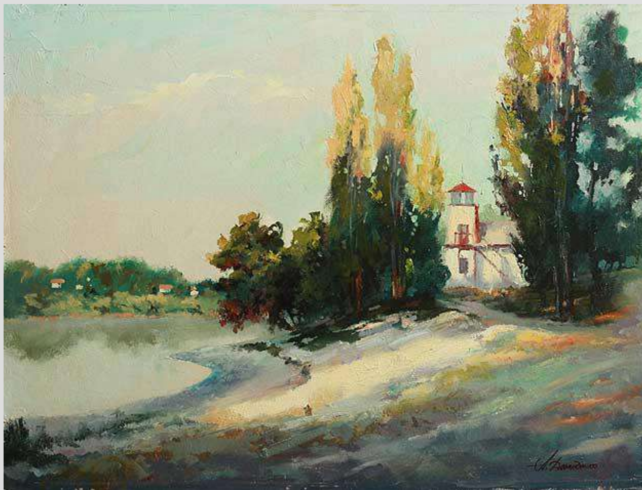
Пирогово. Перші промені 2012 Картон, олія 40x27