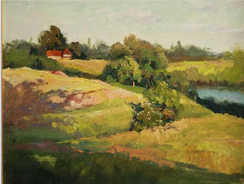
Над Синюхою. Торговиця 2011 Картон, олія 30x39

Олександр Володимирович працює в напрямку реалістичного живопису. Провідним в його творчості є пейзаж. Майстер передає в своїх роботах відтінки освітлення, гру сонячних відблисків, мінливість повітряного простору, тим самим увічнюючи на своїх полотнах мить.