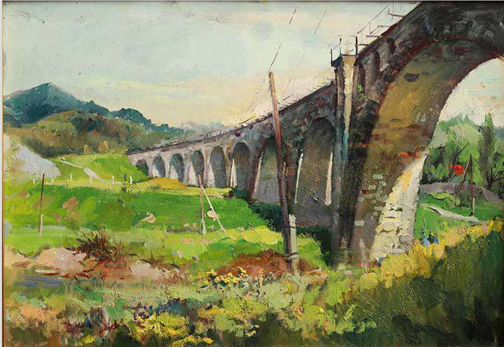
Карпати. Ворохта. австрійський міст 2012 Картон, олія 32x47

У картині спостерігається легкість та сонячний настрій, його любов, прагнення донести чистоту та велич карпатської природи детально зображені на полотні. Картина дуже яскрава, наповнена світлом, контури предметів ніби розчиняються в ньому. Разом з цим художник, залишаючись вірним школі реалізму, вибудовує чітку композицію, яка надає його роботі виразність і завершеність.