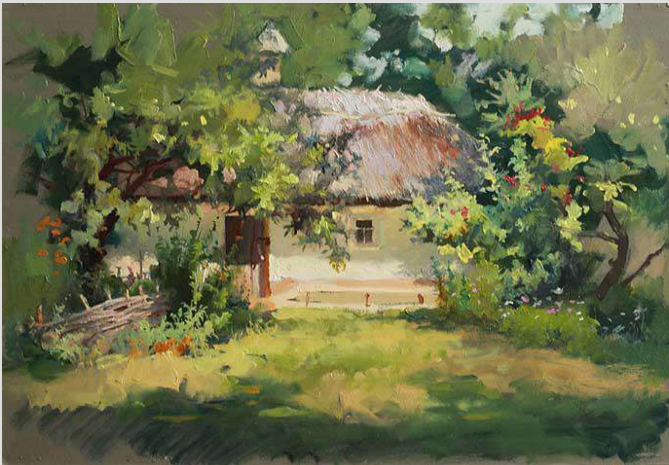
Пирогово. В тіні 2012 Картон, олія 27x39