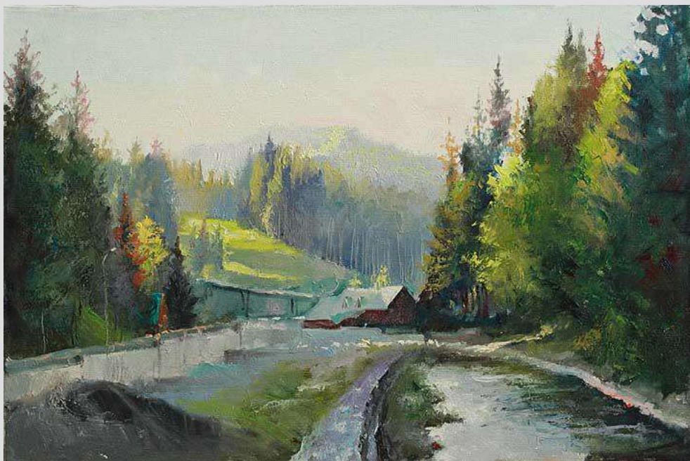
Буковель. Теплий вечір 2012 Полотно, олія 30x45

В роботах автор зображує природу так, як бачить її розосереджений погляд людини, яка цілком поглинута яким-небудь душевним станом і помічає навколо лише те, що співзвучно з нею. Все, що ми бачимо, перетворюється у відлуння настроїв – спокою, щастя, меланхолії.