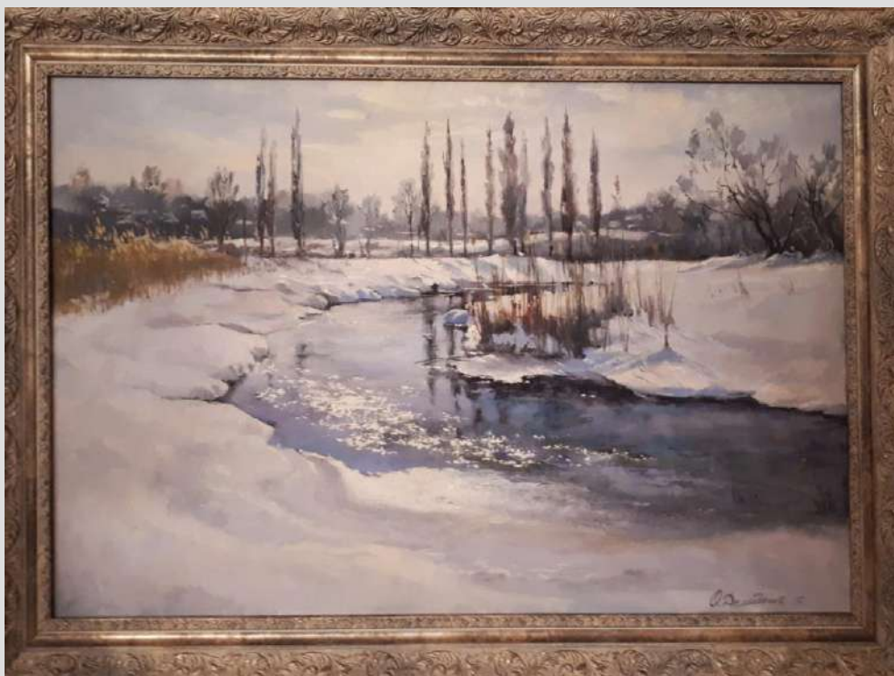
Скоро весна 2017 Полотно, олія

Картина витримана в м'яких і світлих тонах, прозоро-блакитного неба, сліпучо-білого снігу, на якому лежать ніжно-блакитні тіні, легкою, ледь помітною зеленою димкою. Художнику напрочуд добре вдалося передати на полотні відчуття пробудження природи, свіжість і тепло перших весняних днів. Майстерно показана неяскрава краса і тонкий ліризм, чисті кольори надають їй емоційність і життєрадісність, а чітка, врівноважена реалістична композиція робить її неймовірно живою.