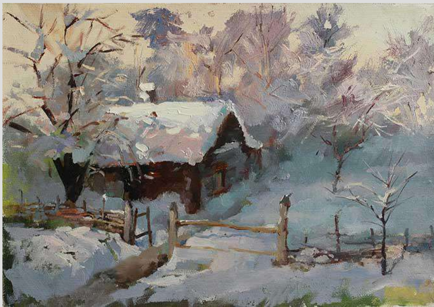
Пирогово. Зимовий ранок 2011 Полотно, олія 22х33

Роботам художника притаманні чистота і прозорість кольорів, гармонійне їх поєднання, тонкий ліризм. Впевненим, невимушеним мазком майстер передає різнобарв'я оточуючого світу у всіх його проявах: від стриманої палітри похмурого зимового дня до відкритих кольорів закарпатського сонця.