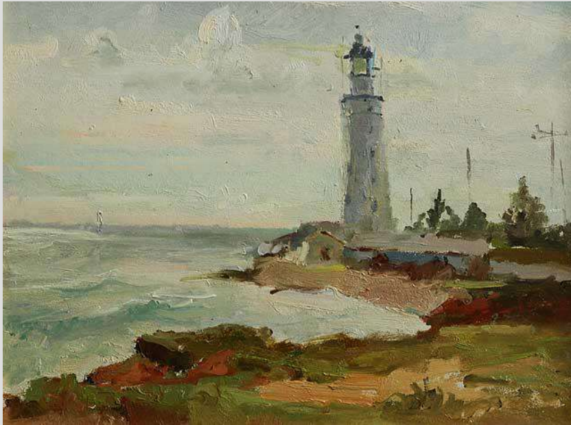
Тарханкут, 2010, картон, олія 30x40