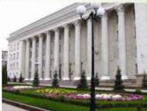
Будинок обкому Компартії України (арх. Л. Дворець В. Сікорський, 1954). Нині Кропивницька міська рада