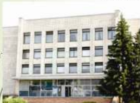
Будинок політосвіти 1972 року. Нині Кропивницький кібернетико-технічний коледж

За СРСР Кропивницький був забудований багатопверховими (на той час) адміністративними, громадськими та житловими будинками, серед яких: