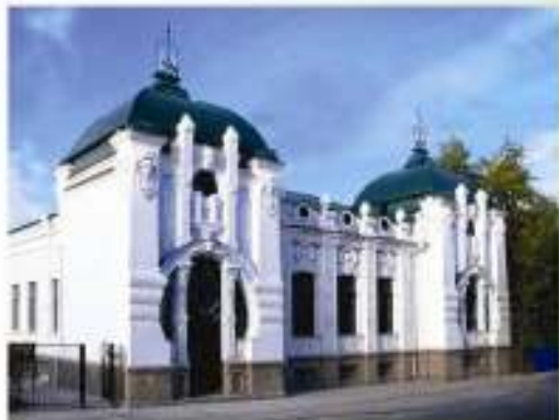
Будинок Барського, збудований у стилі ранній модерн. У 1885—1905 рр., зараз краєзнавчий музей