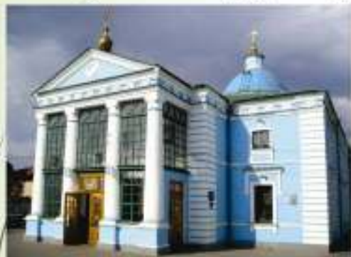
Грецька церква і дзвіниця з будинком настоятеля (1811, 1898)

Починаючи з кінця XVIII ст. місто забудовувалось спорудами у стилі класицизму