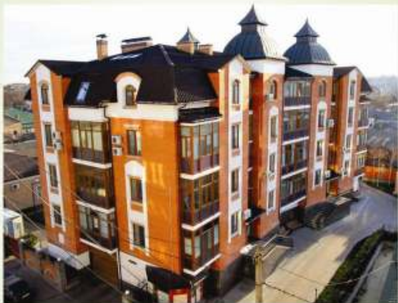
Житловий будинок по вул Дзержинського 56, у Кропивницькому.