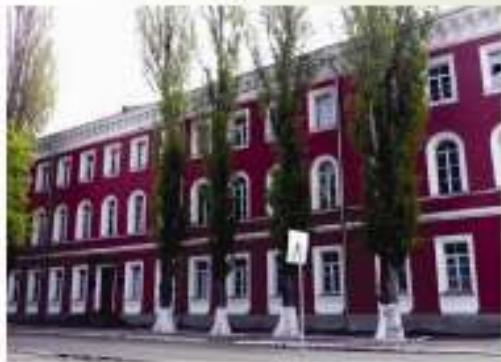
Палацовий корпус ансамблю штабу юнкерського училища та манежу (40-і рр. XIX ст.)