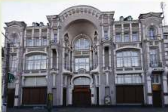
Будівля Пасажу — зараз обласний художній музей. 1887