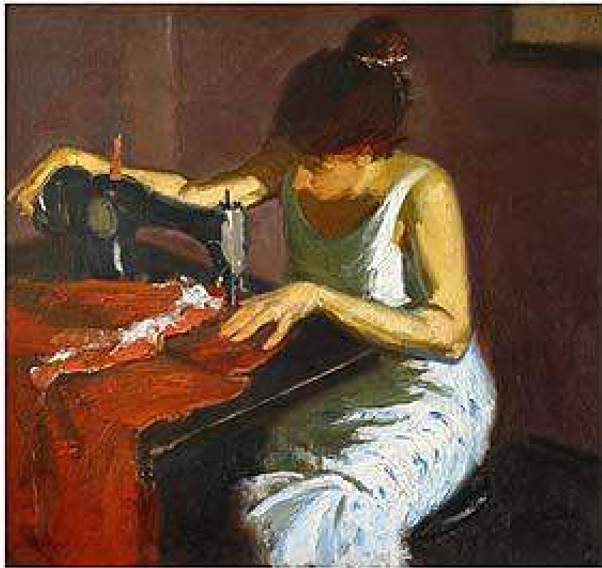
Швачка. 1974. Полотно, олія. 53x55 Швея. 1974. Холст, масло. 53x55 Seamstress. 1974. Oil on canvas. 53x55