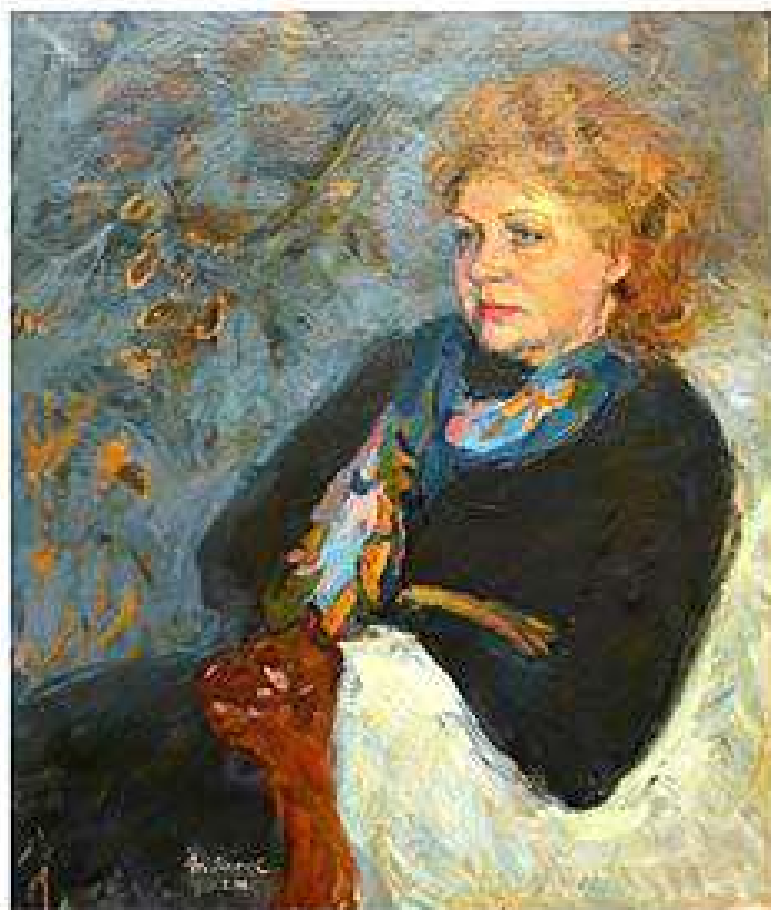
Портрет дружини. 2000. Полотно, олія. 80x61 Портрет жєны. 2000. Холст, масло. 80x61 Portrait of wife. 2000. Oil on canvas. 80x61