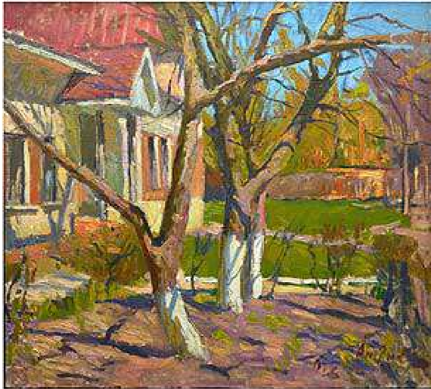
Весна біля дому. 2013. Полотно, олія. 73x83