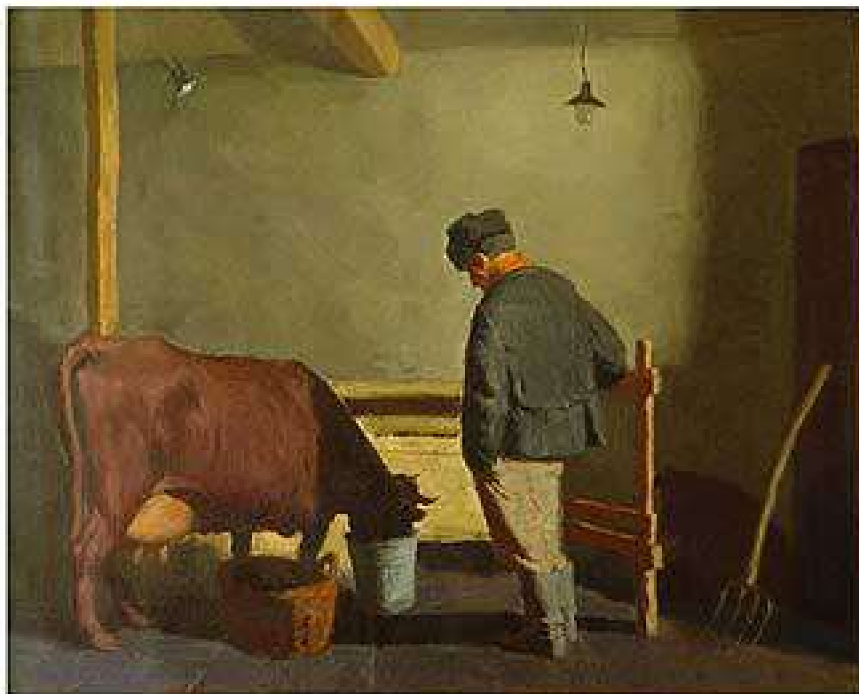
Ранок. 1990. Полотно, олія. 100x115 Утро. 1990. Холст, масло. 100x115 Morning. 1990. Oil on canvas. 100x115