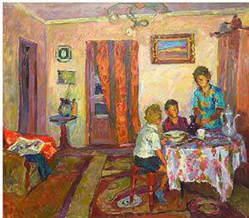
Прийшли діти. 2013 Полотно, олія. 90x103