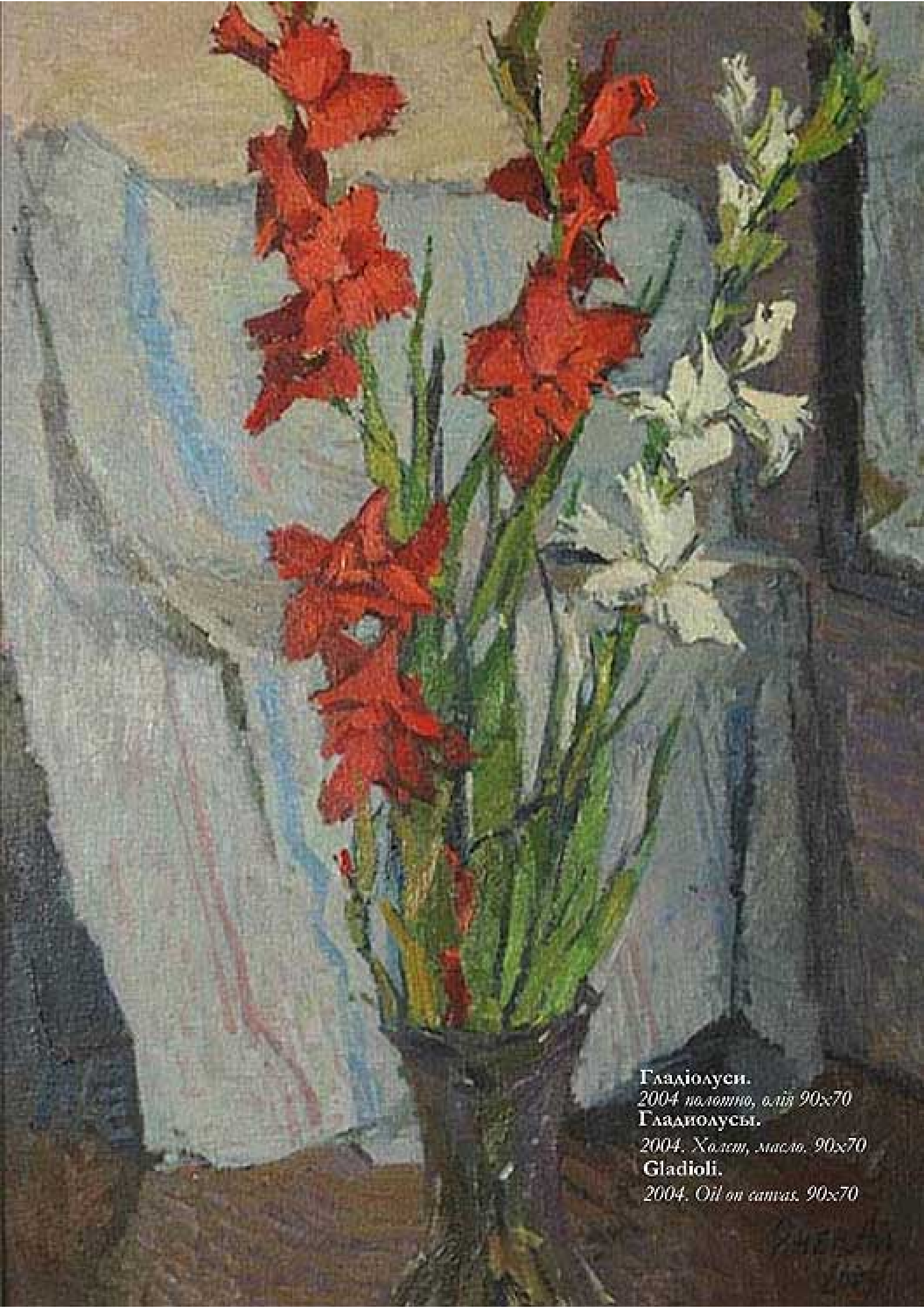
Гладиолуси. 2004. полотно, олій 90x70 Гладиолусы. 2004. Холст, масло, 90x70 Gladioli. 2004. Oil on canvas, 90x70