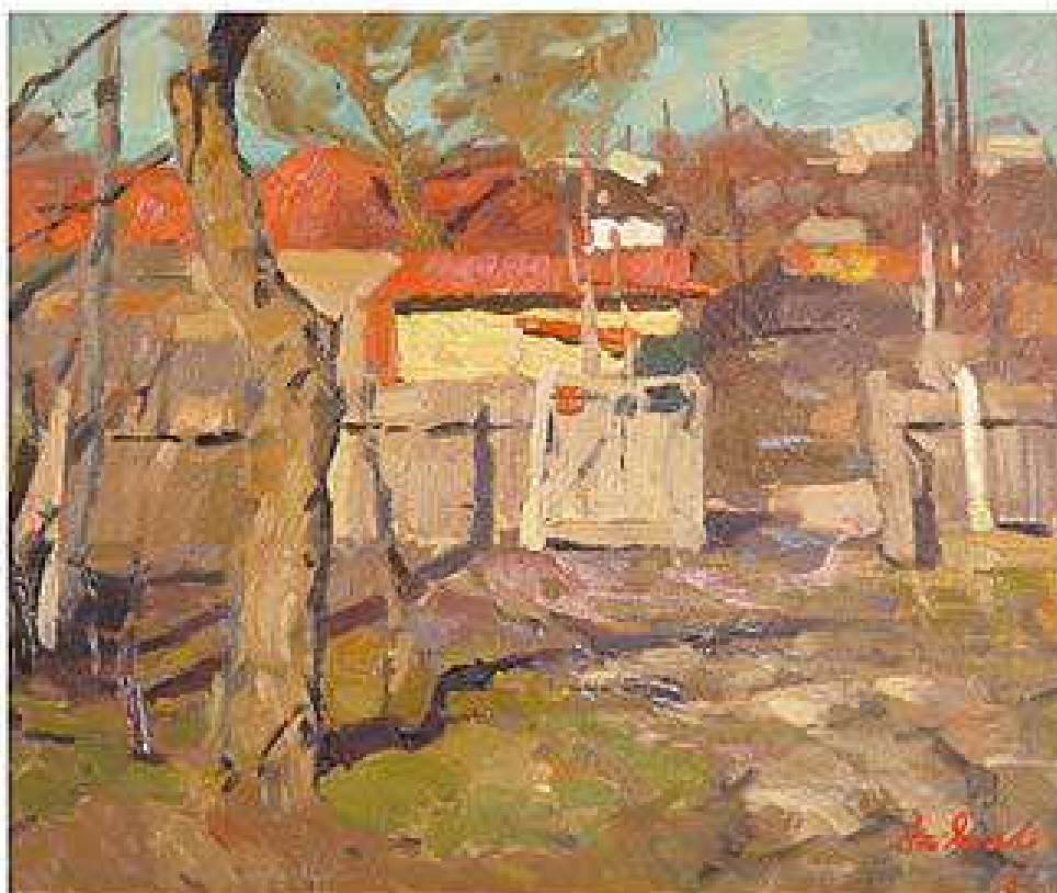
Озерна балка. 1981 Полотно, олія 45x53