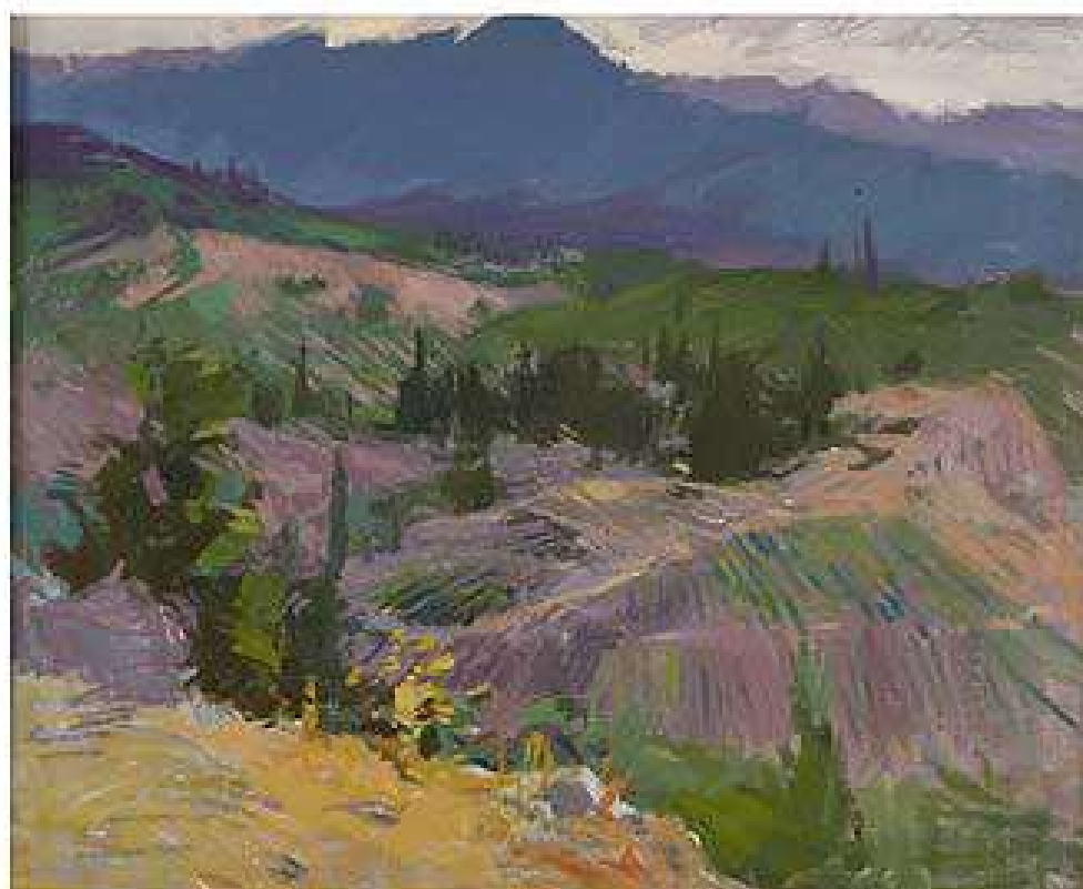
Гора Четир-Даг. 2000. Полотно, олія, 62,5x54

Гора Четыр-Даг. 2000. Холст, масло, 62,5x54