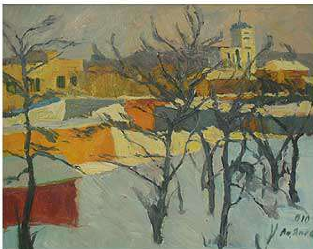
Сонце зимою. 2010. Полотно, олія. 55x70 Солнце зимой. 2010. Холст, масло. 55x70 Sun in winter. 2010. Oil on canvas. 55x70