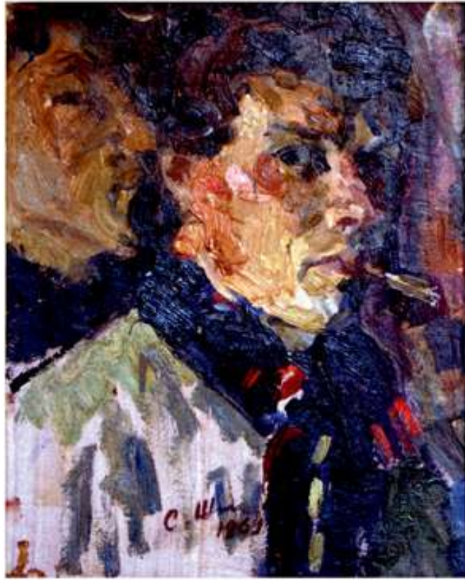
Автопортрет. 1969. Картон, олія. 33x28