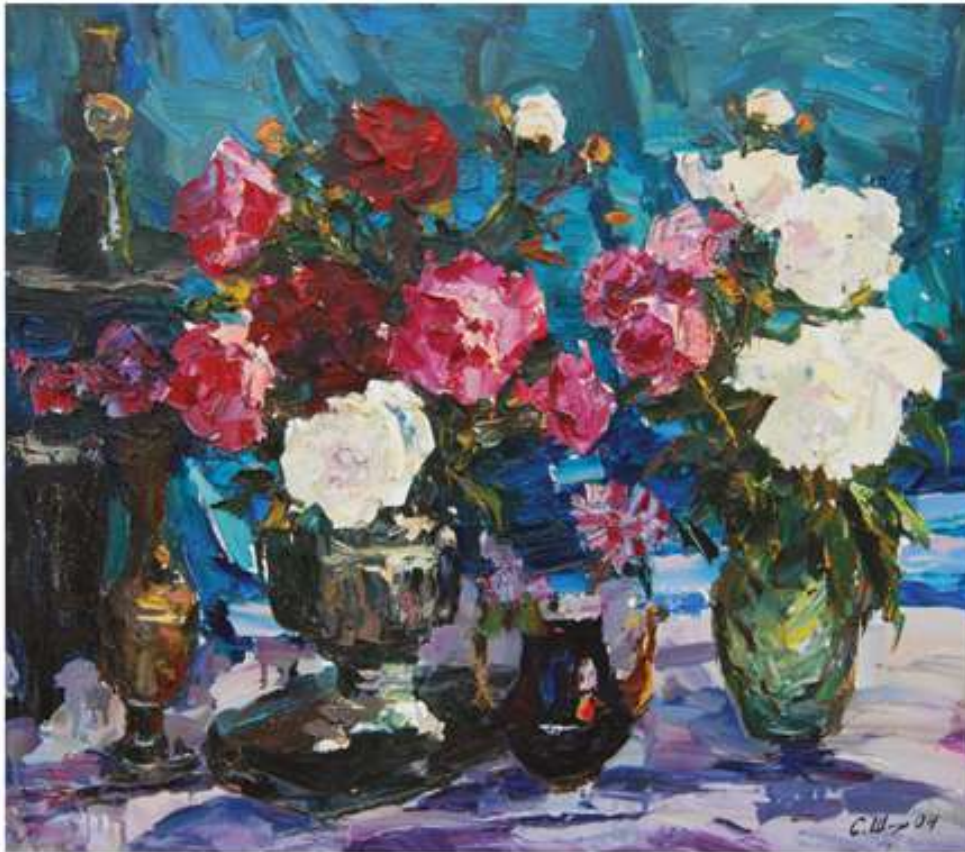
Півонії на зеленому. 2004. Полотно, олія. 70x80