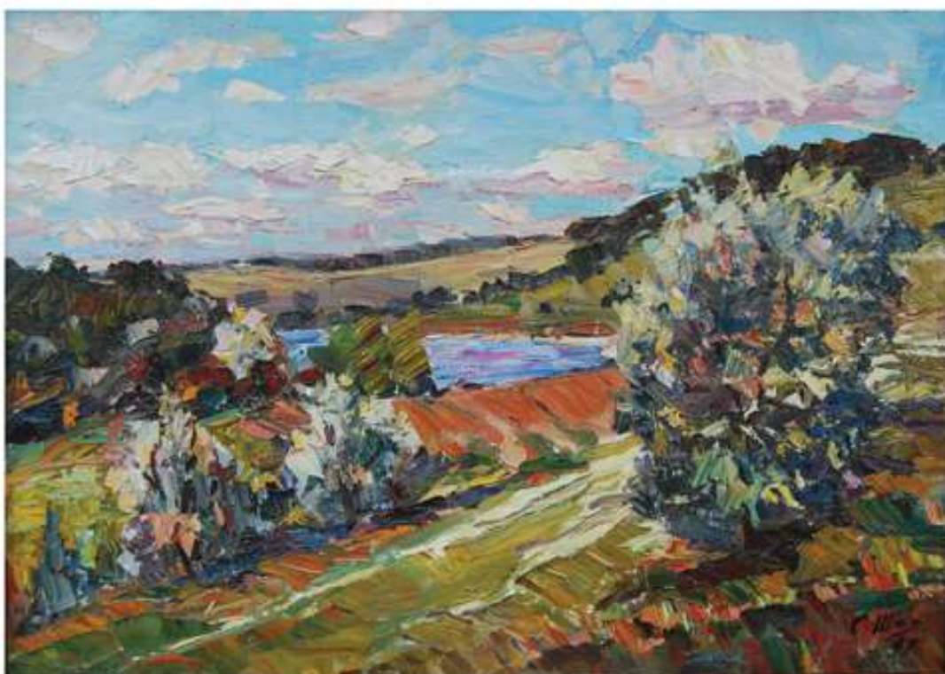
Велика Северинка. 1990. Полотно, олія. 50x70