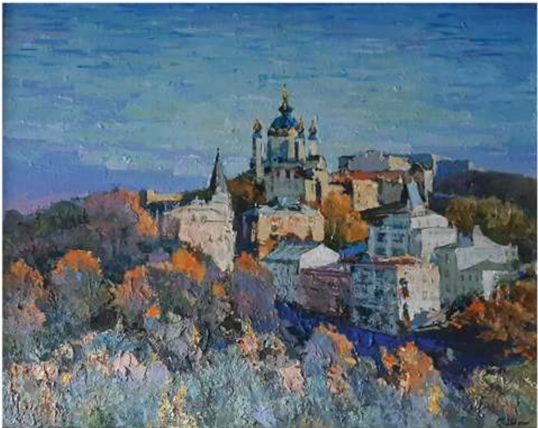
Величний храм. 2004. Полотно, олія. 79x87