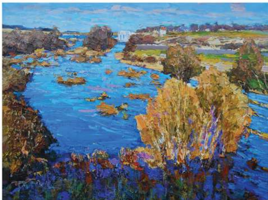
Річка Синюха. Промінь сонця. 2007. Полотно, олія. 77x100