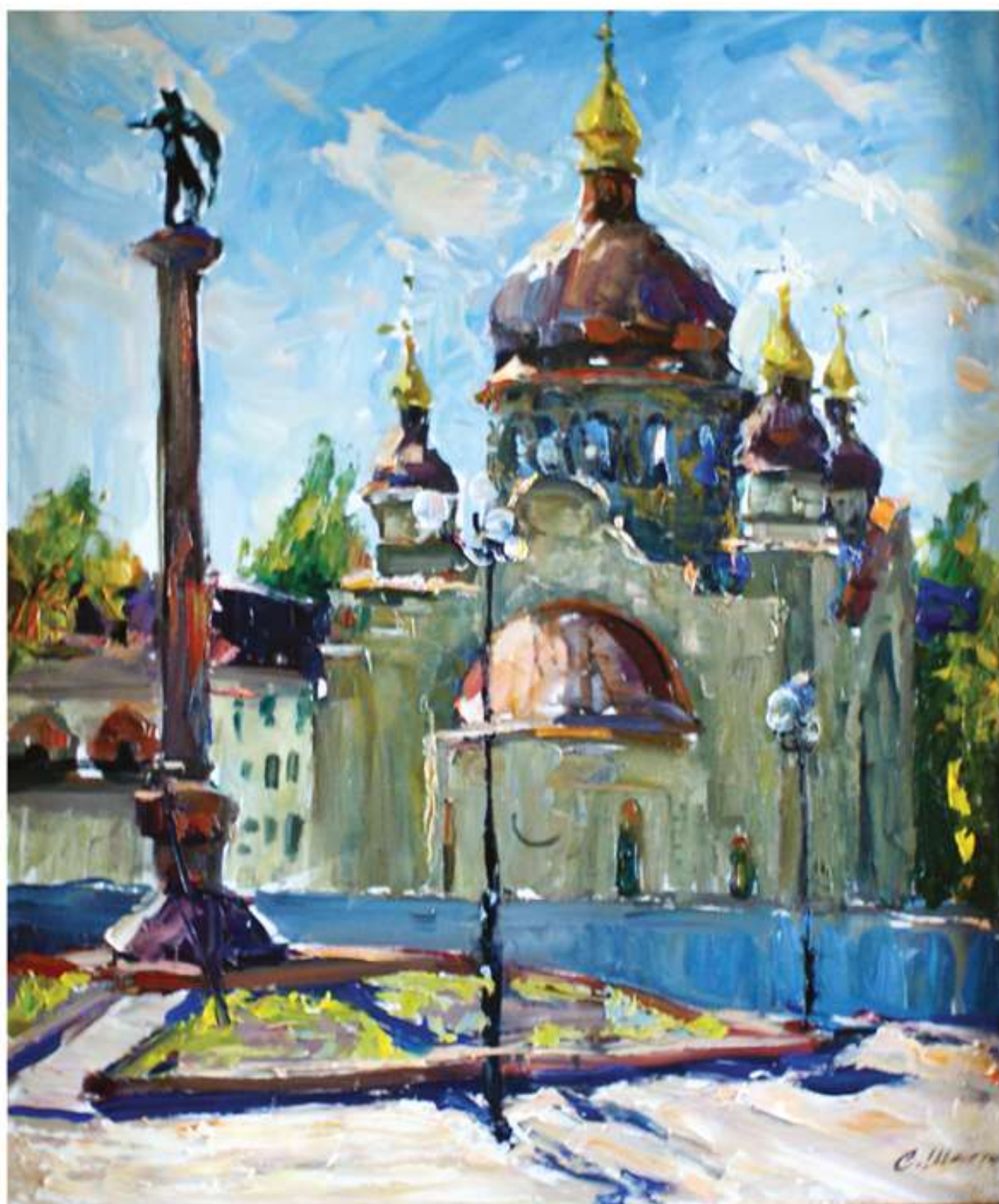
Будується храм. 2014. Полотно, олія. 85x70