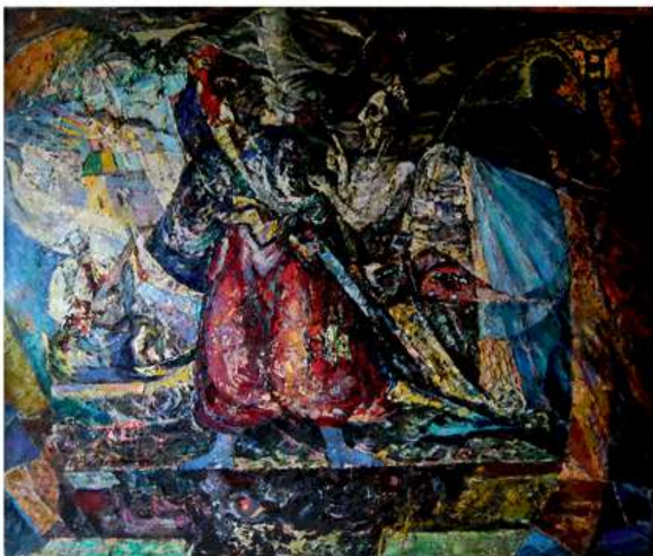
Козацький дух боротьби. 1997. Полотно, олія. 100x125