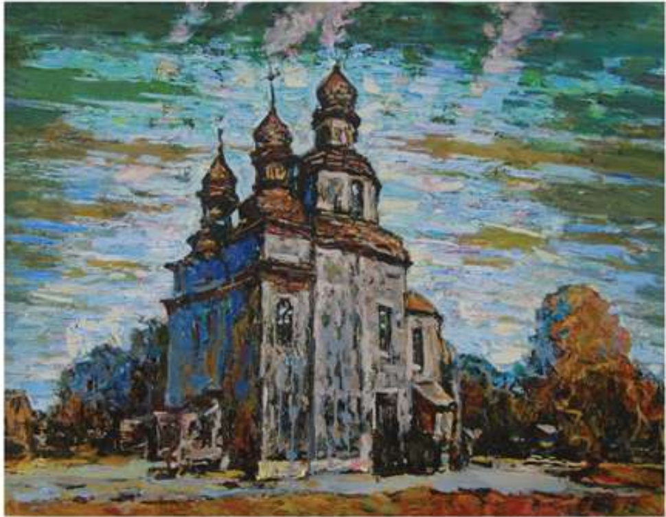
Плин часу. 2014. Полотно, олія. 70x90.