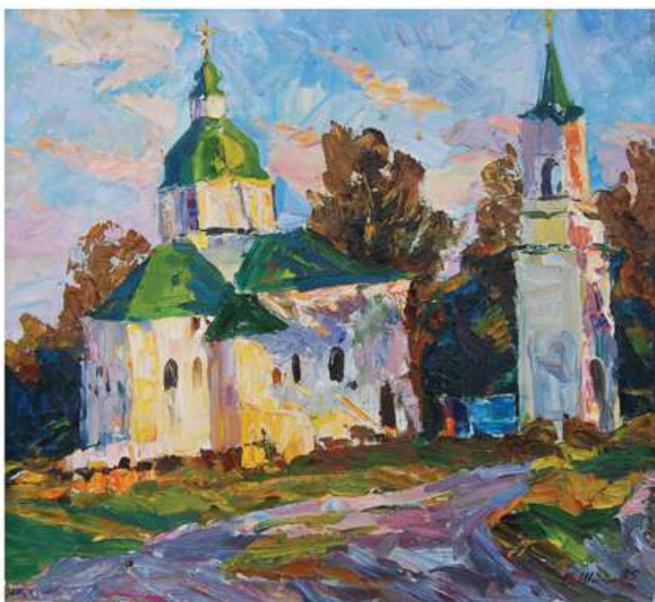
Відблиск сонця. 1985. Полотно, олія. 57x52,5