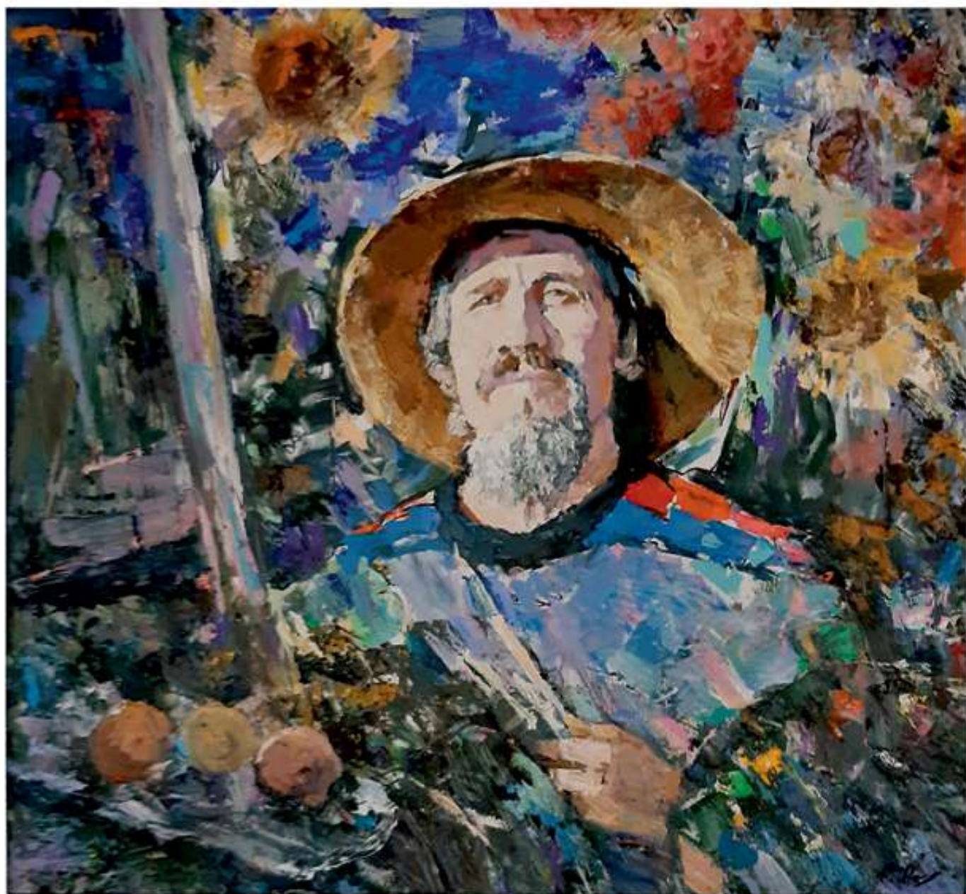
Автопортрет. 2017. Полотно, олія. 75x80