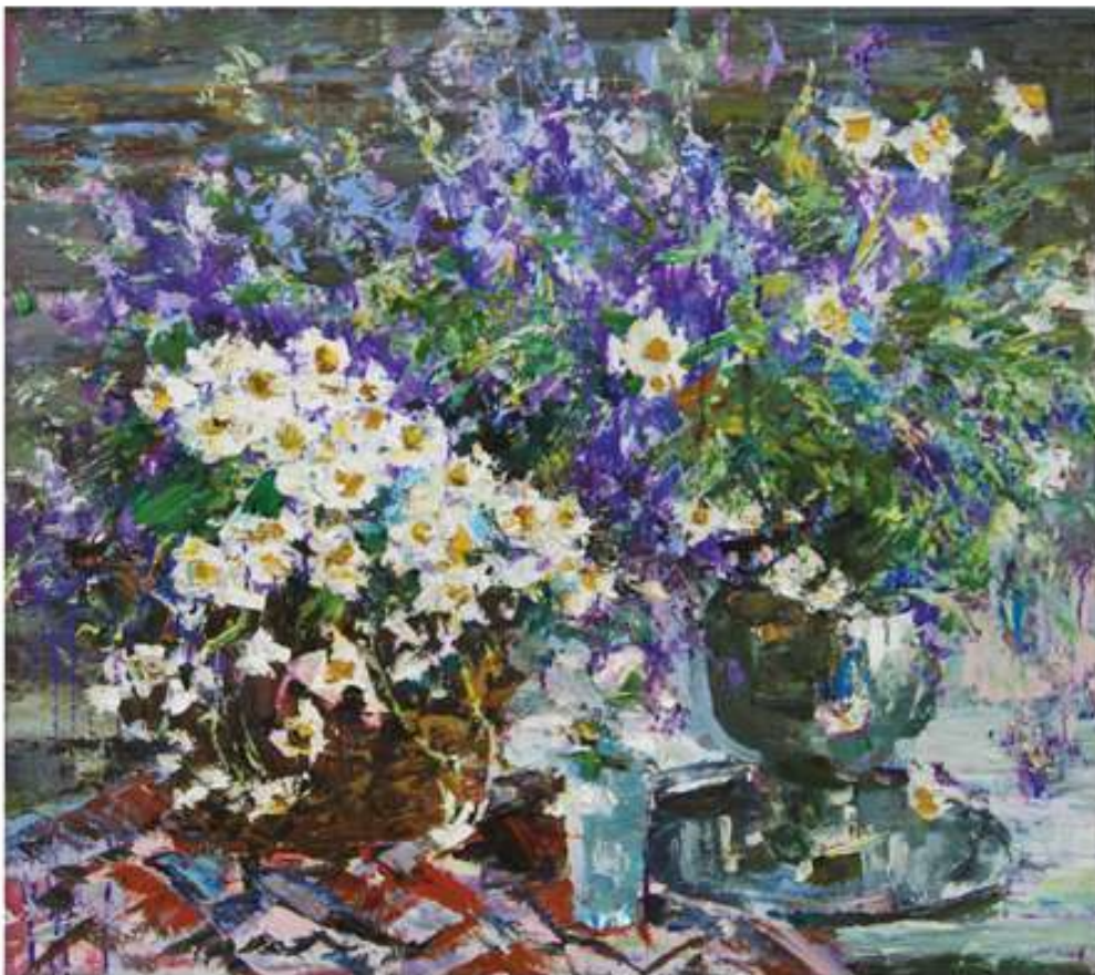
Поле надихас. 2020. Полотно, олія. 75x85