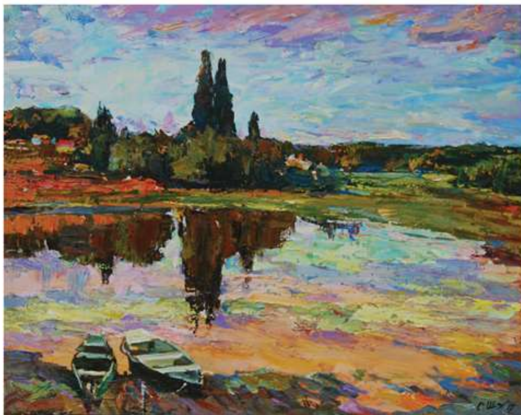
Теплий вечір. 2017. Полотно, олія. 70x95