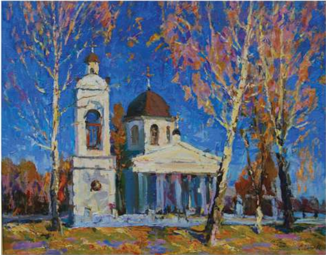
Осінь в Розумівці. 2011. Полотно, олія. 75x95