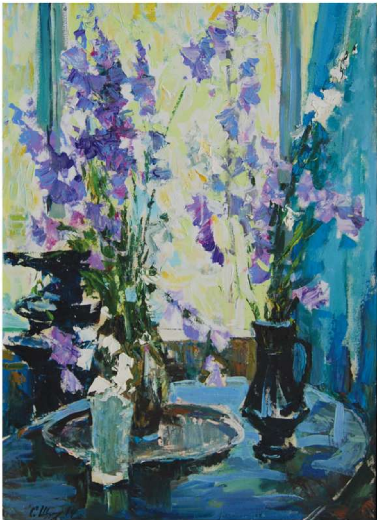
На вікні... 2014. Полотно, олія. 60x84