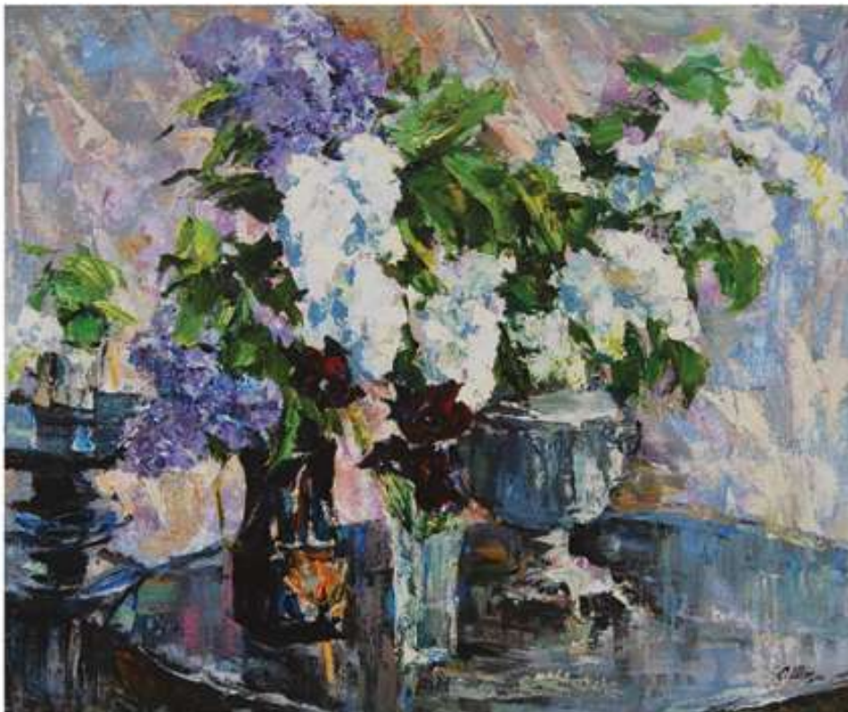
Весна пробуджується. 2020. Полотно, олія.. 70x90