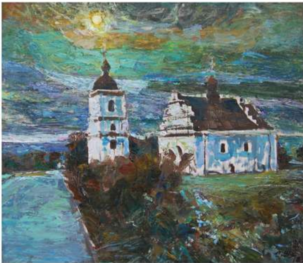
Вічність Богдана. 2018. Полотно, олія. 70x80.