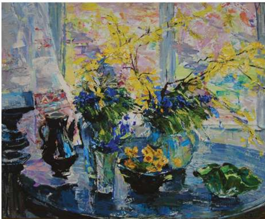
Знову весна. 2020. Полотно, олія.. 79x85