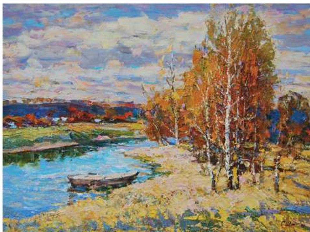
Осінній пейзаж. 2010. Полотно, олія. 67x90