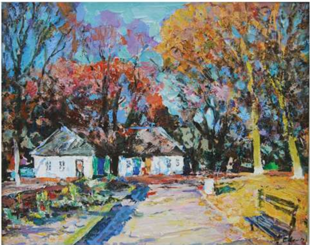
Хутір Надія. 2017. Полотно, олія. 65x80.